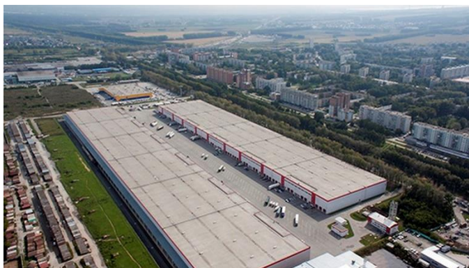
СКЛАДСКОЙ КОМПЛЕКС СИБИРСКИЙ