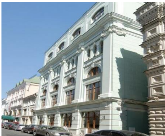
БИЗНЕС ЦЕНТР НА ВЕТОШНОМ