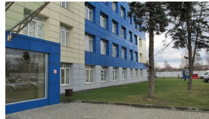
ФАБРИКА ТЕАТРАЛЬНЫХ ПРИНАДЛЕЖНОСТЕЙ СТД РФ