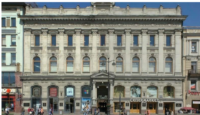
ТЦ НЕВСКИЙ ПАССАЖ