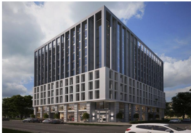
БИЗНЕС ЦЕНТР КАПИТАЛ СИТИ