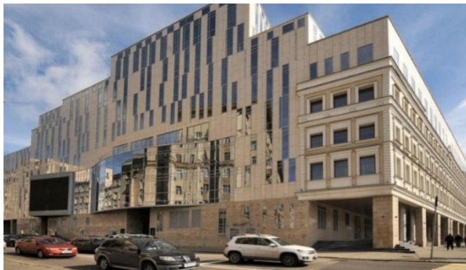
ТЕАТР О. ТАБАКОВА