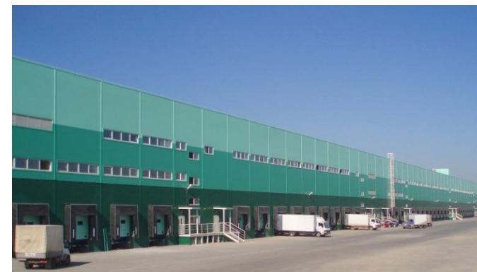
СКЛАДСКОЙ КОМПЛЕКС УРАЛЬСКИЙ